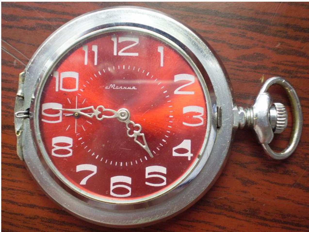
Карманные часы «МОЛНИЯ»